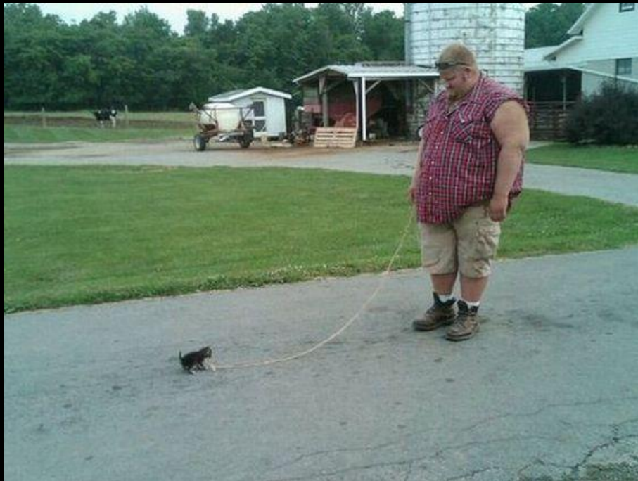
Na UFGN (Universidade Felina de Gatos Ninja) Seu Bichano aprende desde cedo a roer a corda!