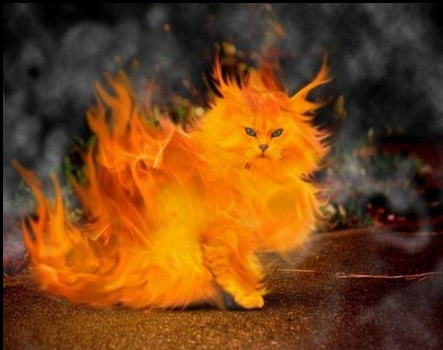
Gato Ninja! Modo Super Sayajin 4.