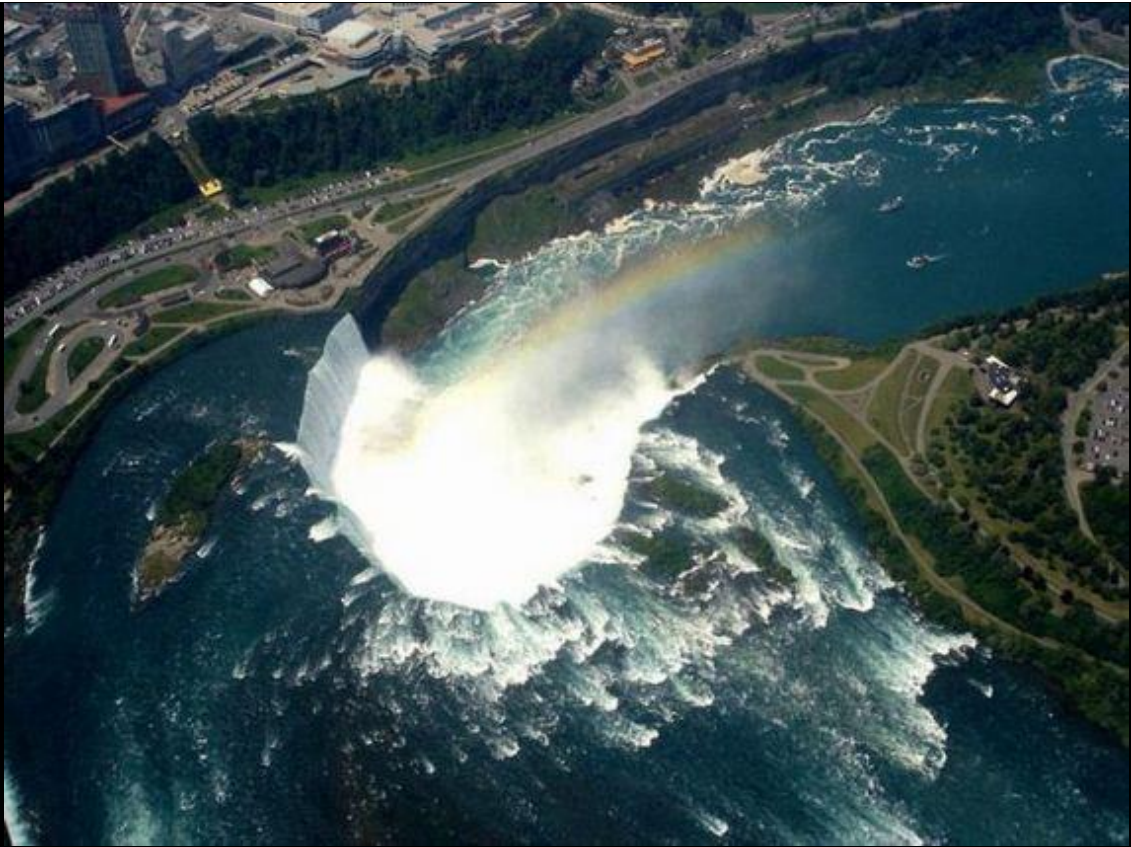
Cataratas do Iguazu.