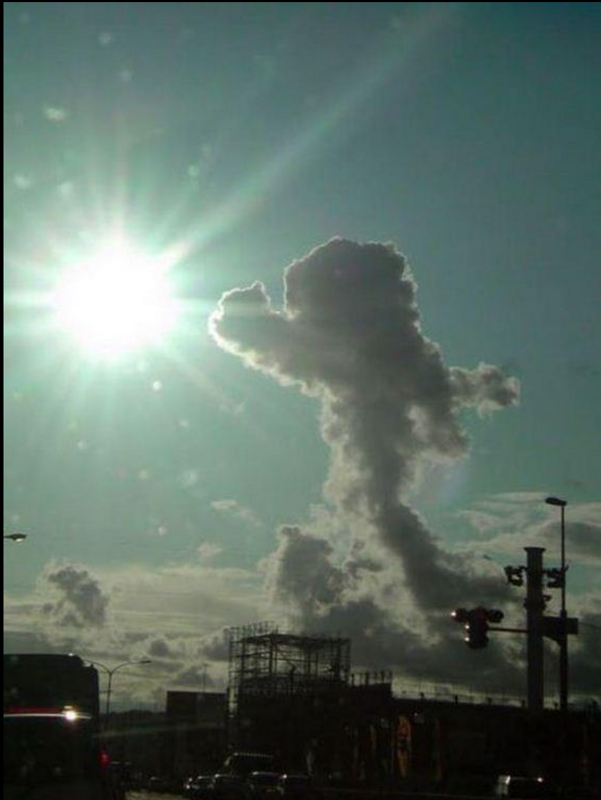
Fotógrafo Ninja ataca! Vai, diz aê?! Foto do C*