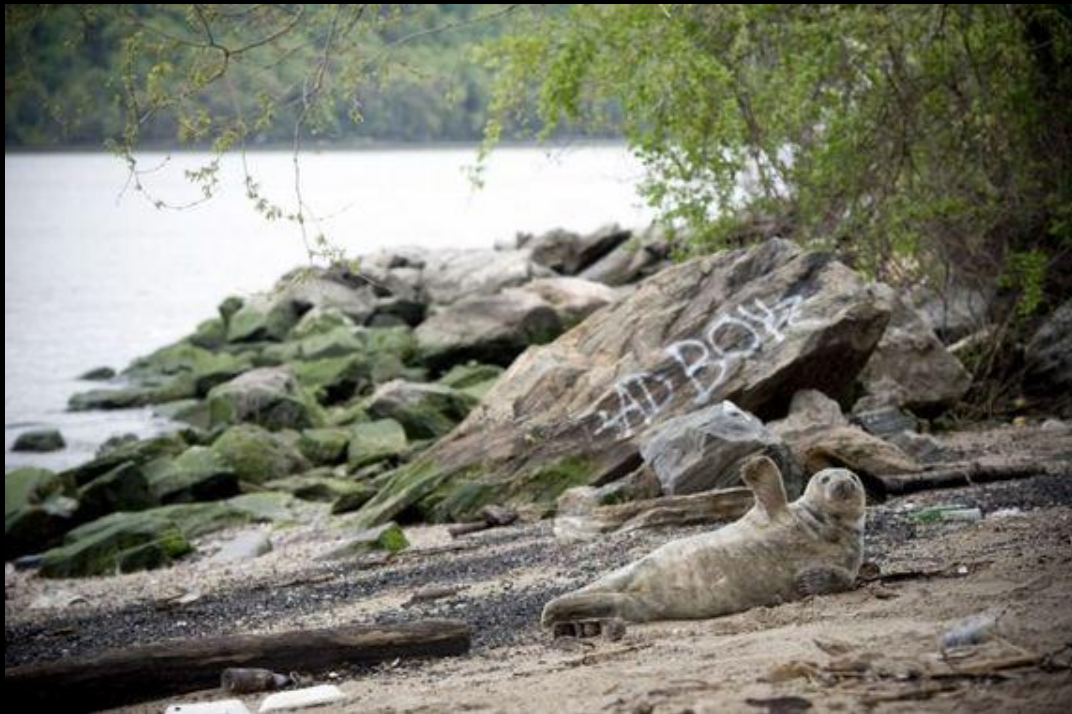
“-OOOiii, Filma eeeu!”