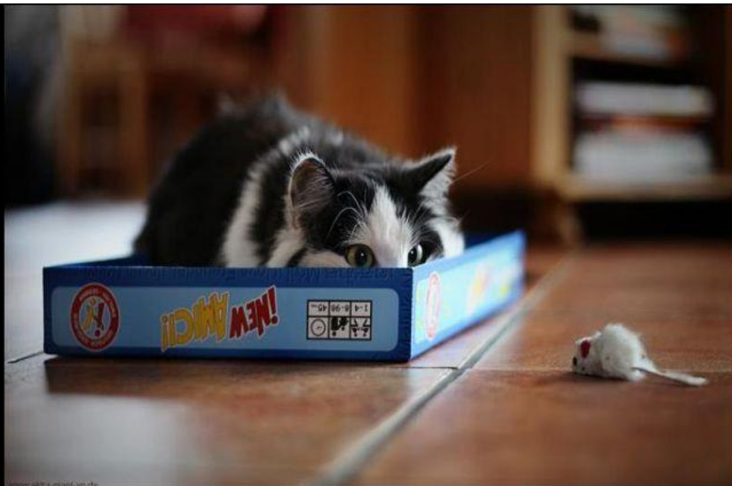
Aula de ataque ninja no laboratório virtual da UFGN (Universidade Felina de Gatos Ninja) (Se liga nos olhos do bichano...)