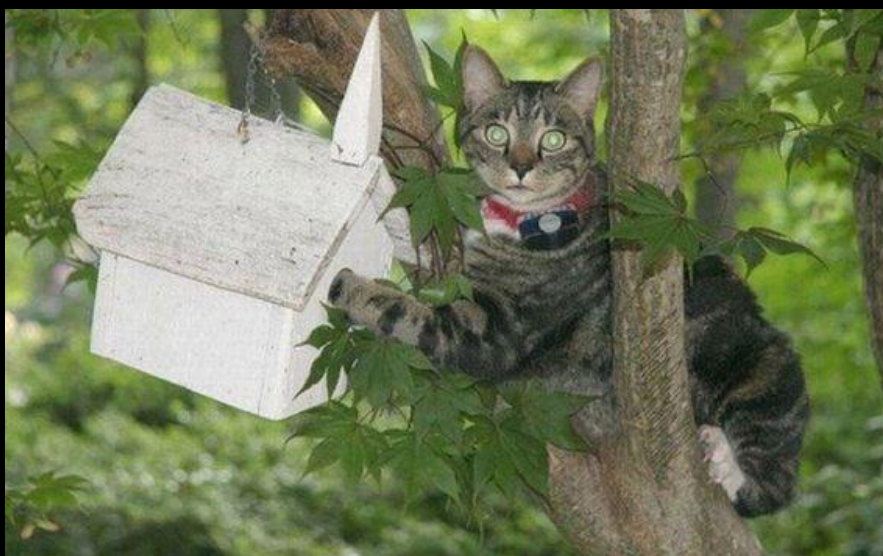
Gato Ninja. Ele sabe o caminho!