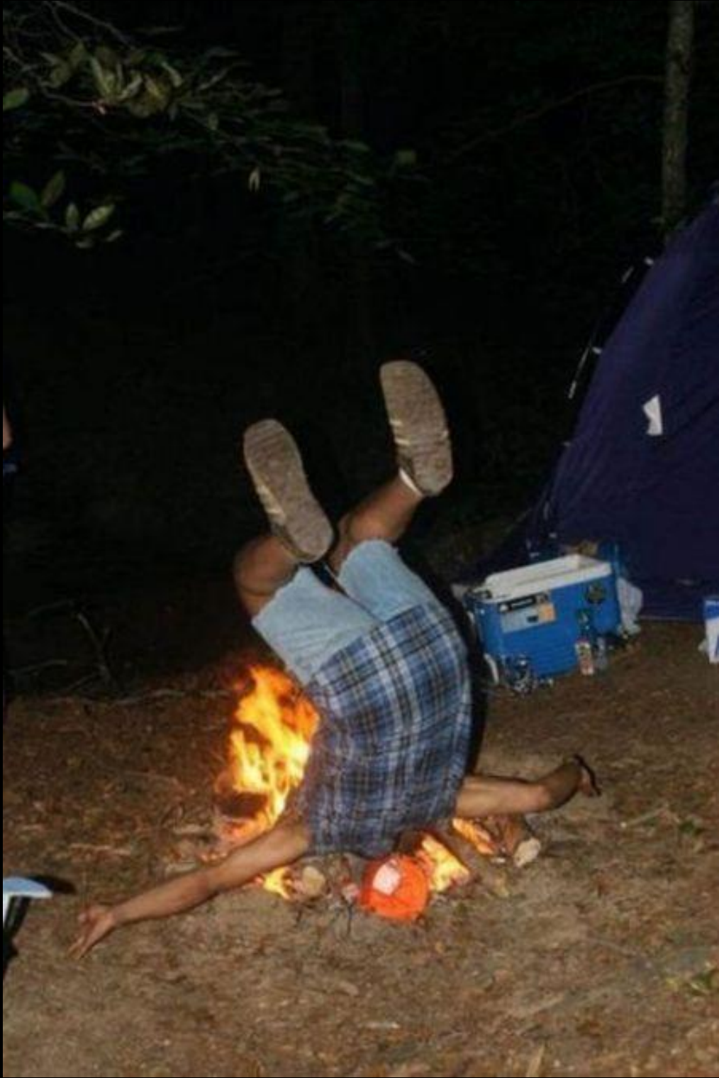
Motoqueiro fantasma dançando break