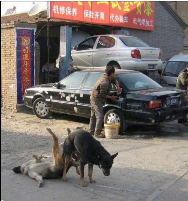
“- Biografia não autorizada de Rintintim.”