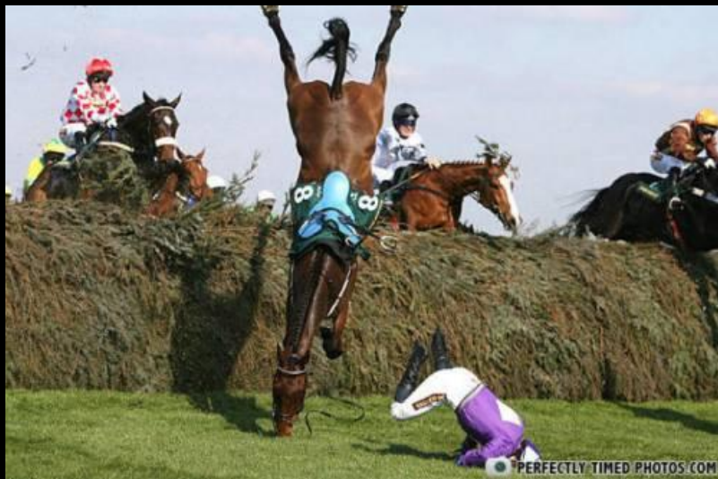
Breakdance X Hipismo