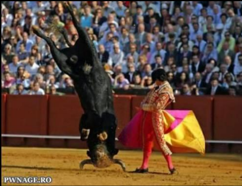
Breakdance X Toradas