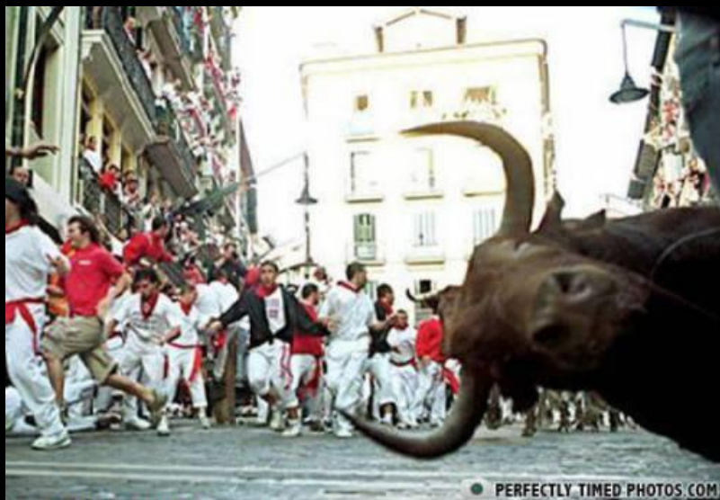
"- Oooooi, fotógrafo..."