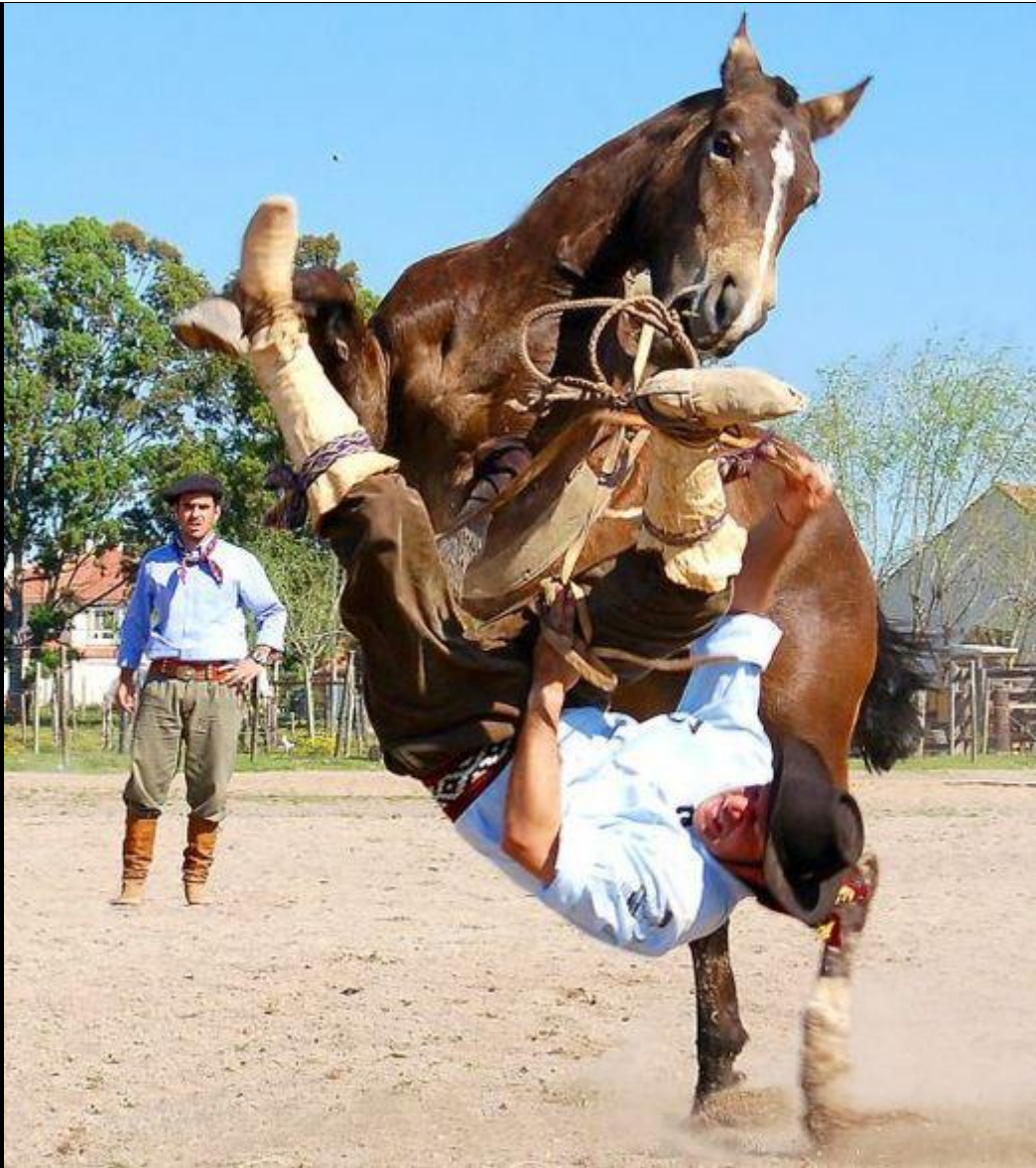
Breakdance X Rodeio