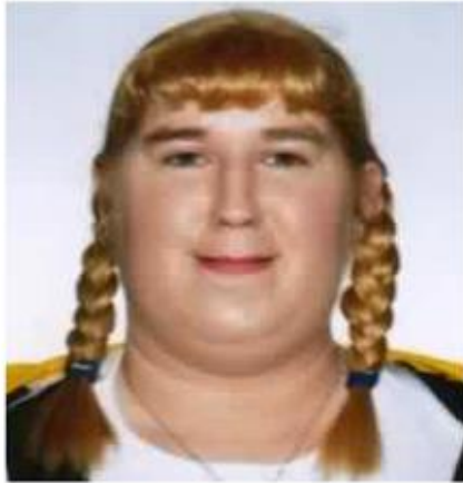
Imagem do Pai