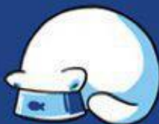
ELIMINADOR DE ALIMENTOS