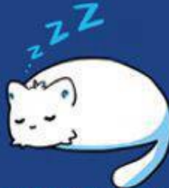
EXPERT EM SONO