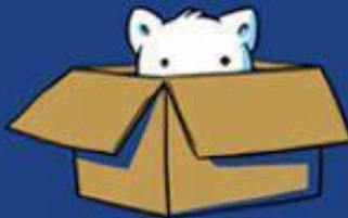
INSPETOR DE CAIXAS